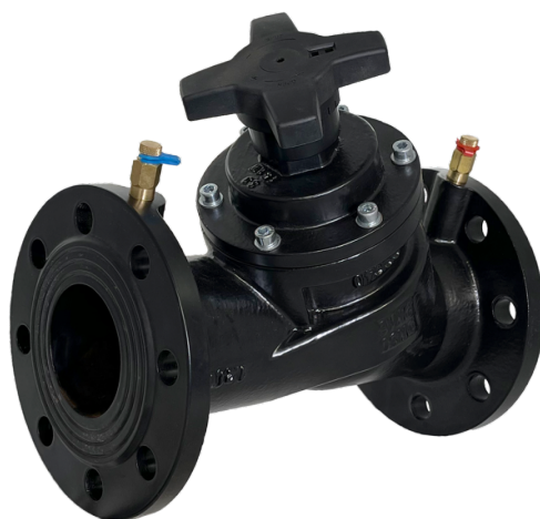
Рис. 1 Общий вид клапана типа MNF, модификация MNF-R

Клапаны балансировочные типа MNF, модификация MNF-R (далее – клапан MNF-R) используются для монтажной наладки трубопроводных систем тепло - и холодоснабжения зданий и сооружений с целью обеспечения в них расчетного потокораспределения.